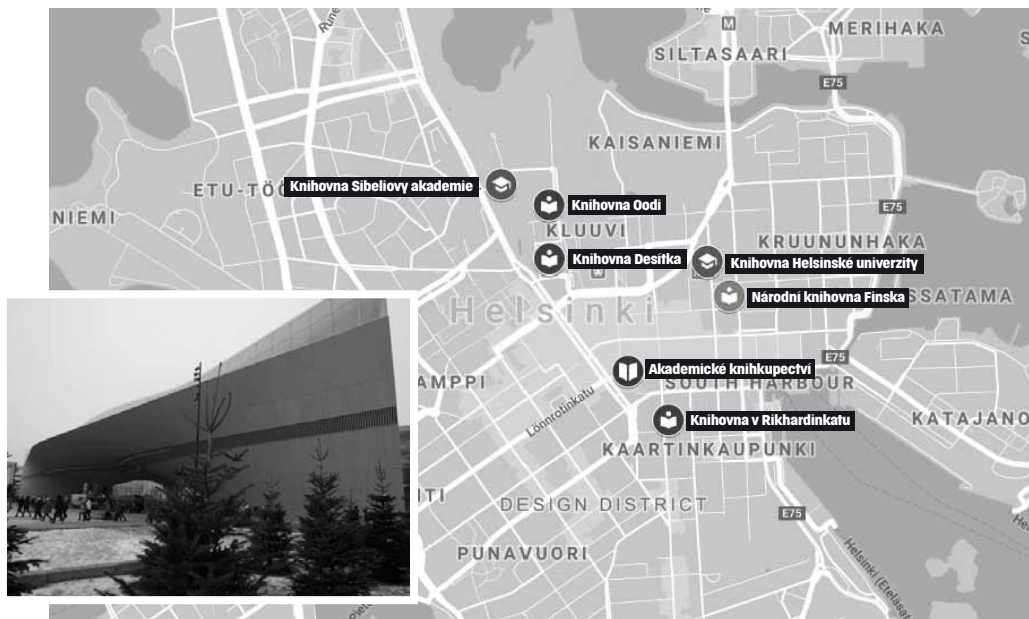
Situační plánec centra Helsinek s vyznačenými místy doporučené k návštěvě či odborným stáží a knihovna Oodi