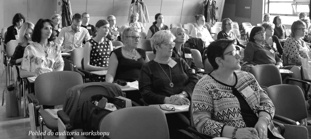
Pohled do auditoria workshopu

ale výtka se týkala skutečnosti, že kulturní a sociální práce paní knihovnice překáží nepřerušované výpůjční době knihovny. Když například nese knihy imobilní čtenářce domů, řeší to vzkazem na dveřích knihovny, že přijde hned. To, co by bylo ve městech nemyslitelné, v obcích tak úplně nevádí a spíše se oceňuje osobní přístup.