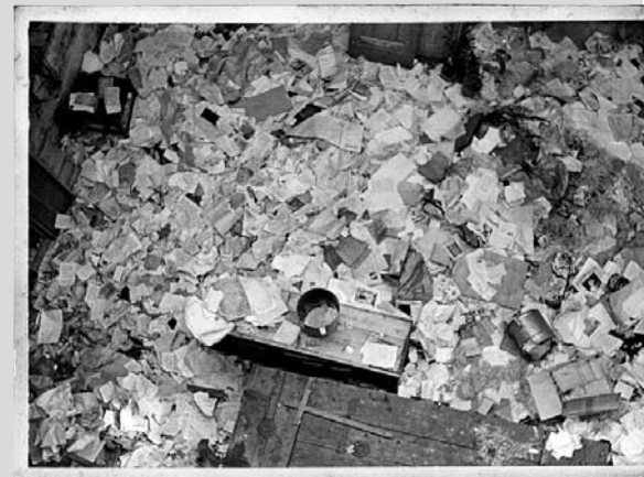
„Srovnané a zabezpečené“ knihy v Klášteře v Kadani

Ve vlhkém sklepě na hromadě až do výše tří metrů naházené knihy, inkunábule, vzácné rukopisy. Některé knihy byly roztrhané, listy vytrhané. Na dvoře jsme viděli po celé ploše poházené hudebniny (psané i tištěné) a staré archiválie, vše vystaveno vlivům povětrnosti. Ve chvíli, kdy jsme se na to dívali, bylo právě po dešti. O své citové reakci nebudu mluvit. Uvádím jen, že dr. Křivskému selhaly nervy. 1