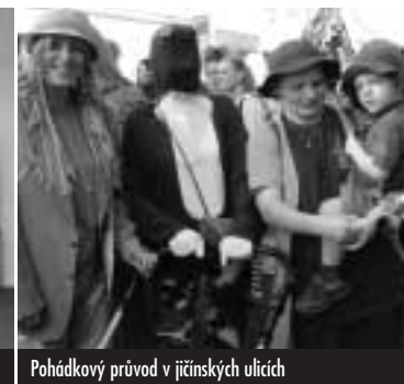
Pohádkový průvod v jičínských ulicích