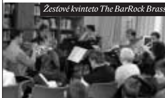
Zestové kvinteto The BarRock Brass

nalá. V oddělení pro děti všechny překvapil velký pytel, který tam pohodil čert – vášnivý, ale nepořádný čtenář. Protože ale všichni vědí, že čerti z českých pohádek jsou spíše pro legraci než pro strach, nebály se ho ani děti a čile s ním diskutovaly. O Knihvypůjčce regálové už jsem se zmínila.