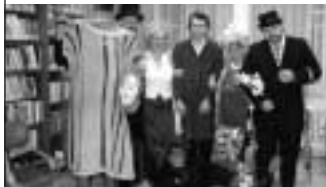
Průvodci po knihovně

Následoval výstup po točitém schodišti na půdu, odkud se ozývaly tajuplné zvuky. Návštěvníci se zatajeným dechem (hlavně ti mladší) vyslechli starozlínskou pověst o rytíři Milošovi, který mečem setnul hlavu obdivované dívky Lidušce, jež ho odmítla, a rytíř za trest musí po smrti chodit s hlavou pod paží. Když se pak bezhlavý rytíř s narikáním „Liduško, Liduško“ objevil, byla iluze doko-