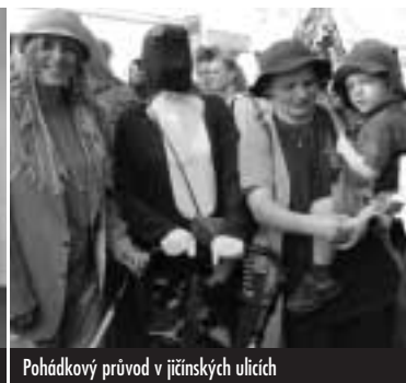
Pohádkový průvod v jičínských ulicích