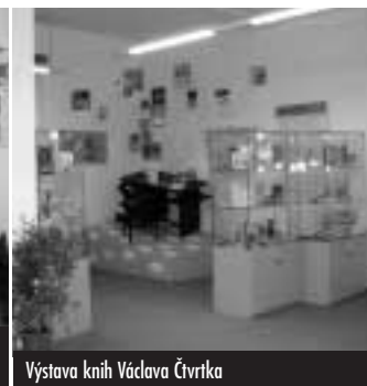
Výstava knih Václava Čtvrťka