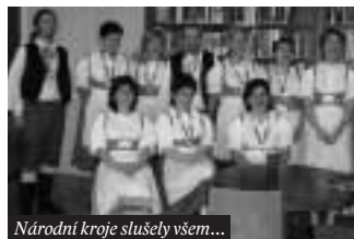
Národní kroje slušely všem...

V sobotu 28. října 2006 byla ve středních Čechách otevřena veřejnosti všechna muzea, galerie a další kulturní zařízení, která má Středočeský kraj ve své správě. Vstup pro návštěvníky byl zdarma.