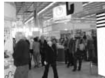
Knižní veletrh intelektuální literatury v Moskvě

Pokud si potřebujeme vytvořit ucelený obrázek knižní produkce v anglickém jazyce, a to především z britských (včetně těch menších), ale i severoamerických nakladatelství, stojí za to se vypravit na mezinárodní knižní veletrh v Londýně : http://www.lbf-virtual.com/ , který se také koná v březnu. Je to poměrně velký veletrh (v roce 2006 se zde očekává více než 1900 vystavovatelů) s tradicí od roku 1972. Mezinárodní obchodní charakter dostal ale až po roce 2000, kdy se stal evropským centrem prodeje autorských práv v oblasti angloamerické knižní produkce. Vedle literárních čtení, přednášek a seminářů lze na veletrhu absolvovat kurz tvůrčího psaní a být u vyhlášení vítěze soutěže