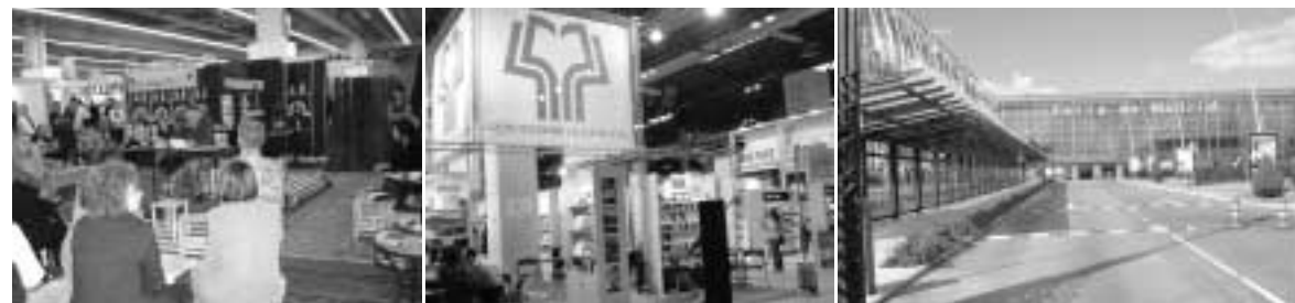
Autorské čtení na veletrhu ve Frankfurtu | Pohled na katalánský stánek a na veletržní areál na knižním veletrhu v Madridu

Největším, nejdůležitějším a vlastně nejstarším evropským veletrhem je Mezinárodní knižní veletrh ve Frankfurtu nad Mohanem (první zmínky o frankfurtském trhu pocházejí z roku 1150), který se koná každoročně vždy v říjnu ve veletržním areálu kousek od frankfurtského Hlavního nádraží. Má velkou tradici – knižní veletrh pak od roku 1949 – a každý rok přiláká tisíce vystavovatelů z více než sta zemí a stovky tisíc návštěvníků. V roce 2005 se zde prezentovalo přes 7200 vystavovatelů z 101 zemí světa. Veletrh má velmi přehledné webové stránky http://www.buchmesse.de , kde se mimo jiné můžete přihlásit jako odborný návštěvník a s předstihem si zakoupit permanentní