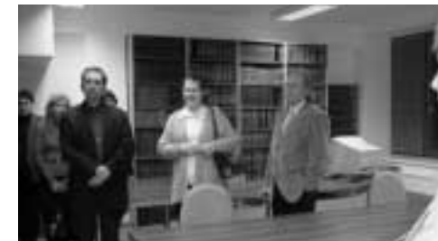
Nahoře: olomoucká konference je tradičním místem setkávání knihovníků, historiků a archivářů. Dole: součástí programu byla i prohlídka nových studoven knihovny