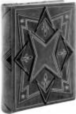
Ukázka kubistické knižní vazby