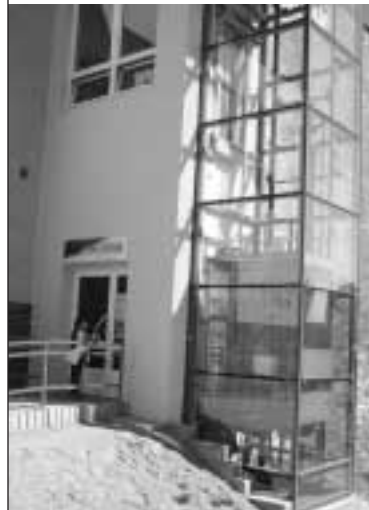
Bezbariérový přístup do Obvodní knihovny Plzeň-Lochtín s dominantou proskleného bezbariérového výtahu

věnujeme zvýšenou pozornost. Jejich dotazy a požadavky patří k nejnáročnějším. Snažíme se jim ve všech směrech vyhovět, pomáháme jim s vypracováním referátů i odborných a vědeckých prací. Pro děti ze základních a mateřských škol pořádáme výchovné lekce, exkurze a besedy o knihovně a knihách. Připravujeme pro ně zajímavé soutěže o ceny, které jsou velkou motivací k návštěvě knihovny a také ke čtení knih.“