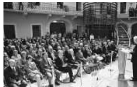
Otevření knihovny 17. 4. 2005

Standardní předprojektová a projektová fáze každé investice vyžaduje obvykle více času, který v tomto případě nebyl k dispozici. Etapa přípravných prací (průzkumy, projekty, veřejné zadávání) byla opravdu krátká, avšak delší vzhledem k plánovanému termínu realizace. Bylo nutné vystěhovat, přemístit a přestavět asi dva miliony knih, což do té doby na Slovensku a ještě ke všemu za provozu, nikdo nedělal. Stavební práce začaly v srpnu 2002, ale až do dubna 2003 se knihy půjčovaly a studovny fungovaly, i když to probíhalo v prostředí zvyšují-