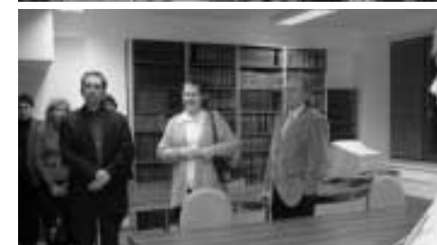
Nahoře: olomoucká konference je tradičním místem setkávání knihovníků, historiků a archivářů. Dole: součástí programu byla i prohlídka nových studoven knihovny