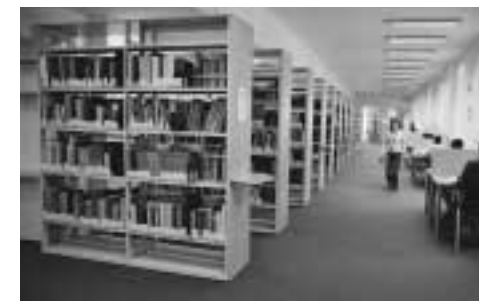
Studijní místa a volný výběr dokumentů

Jedna věc je stavět jakoukoli novostavbu na „zelené louce“, jiná rekonstruovat starou budovu. Můžeme potvrdit, parafrázujíc kterýkoliv z Murphyho zákonů, že když se něco nemá najít, tak se to najde. Zdatní archeologové zbytky jakési hospodářské stavby ze 16. století na parcele pod Lisztovou zahradou skutečně našli, ačkoli geologické a geofyzikální sondy to