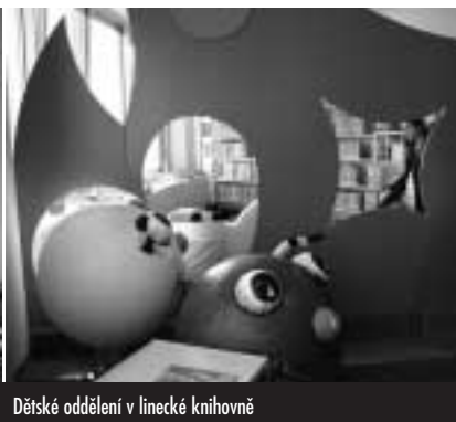
Dětské oddělení v lincecké knihovně