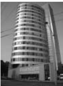
Městská knihovna v Linci