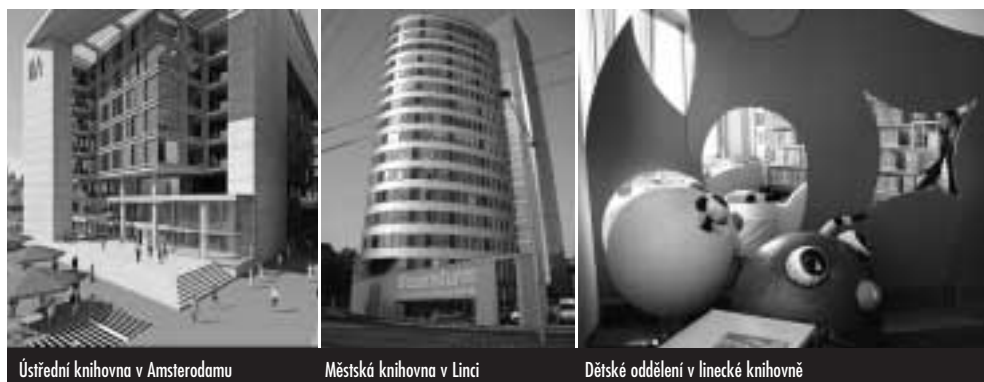
Ústřední knihovna v Amsterdamu