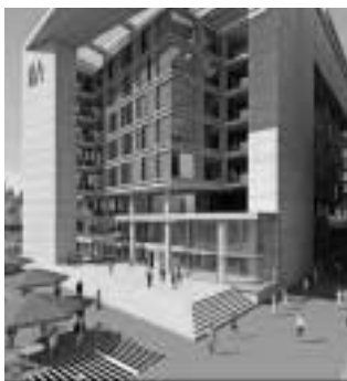
Ústřední knihovna v Amsterdamu