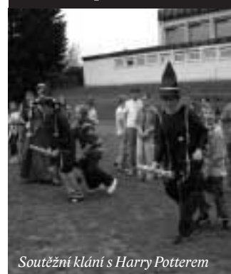
Soutěžní klání s Harry Potterem