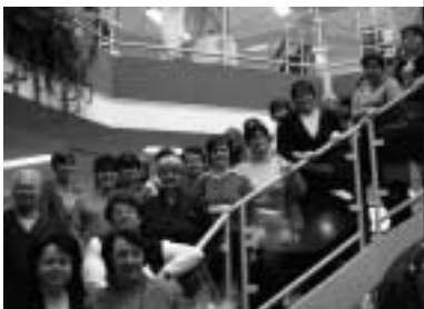
▲ Na návštěvě ve Freyungu

Nyní podrobněji představím naši nejlépe fungující spolupráci s německou knihovnou ve Freyungu.