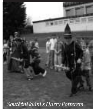
Soutěžní klání s Harry Potterem