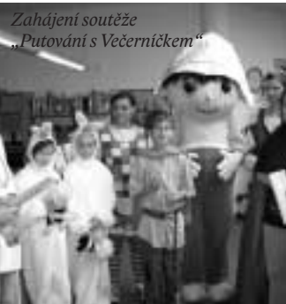
Zahájení soutěže „Putování s Večerníčkem“