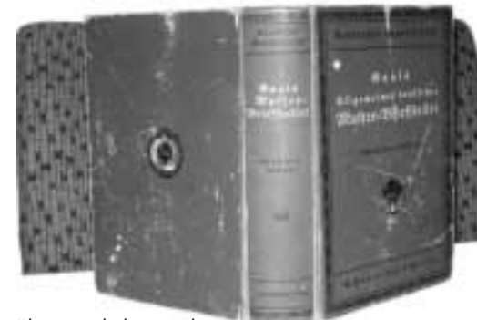
Kdysi nepostradatelný pomocník pro administrativu všech domácností a firem, vydaný kolem roku 1917.

místní odbory. MS také spravuje Národopisný areál v Dolní Lomné, kde každoročně pořádá folklorní festival Slezské dny a řadu jiných kulturních a národopisných akcí. V samotné Opavě se činnost MS zaměřuje na konání odborných přednášek, konferencí, spolkových schůzí, zájezdů, ale i společenských setkání a večerů, jež jsou přístupny nejširší veřejnosti.