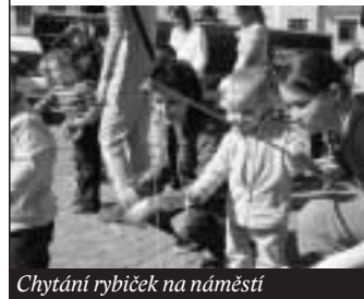
Chytání rybiček na náměstí

a místostarostka města, předvedly děti pohádku o broučcích a pěvecký soubor Cvrčci zazpíval několik písní. Mezitím se setmělo. Rodiče dětem rozsvítili lampióny a průvod berušek, motýlků a různých broučků s lampióny v ruce se vydal do areálu „na hradech“, kde