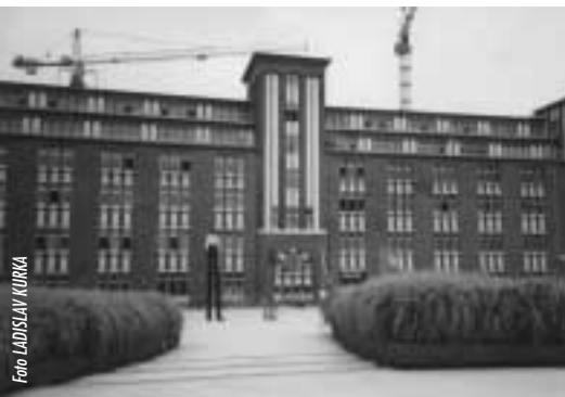
Budova současné knihovny v Hamburku