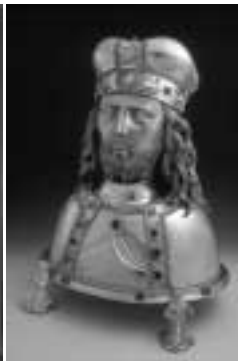
Ostalková busta sv. Václava

nějakého depresivního melancholika, který pořád myslí na smrt – naopak víme, že světské radovánky mu nebyly cizí. V jedné básni, v níž líčil příteli, co právě dělá, napsal „ vivimus et bibimus “ (žijeme a pijeme), tedy že daleko více nežli básni si užívá Bakchových darů. Také této stránce Bohuslavova života a doby jsme věnovali jeden malý oddíl v rámci naší výstavy.