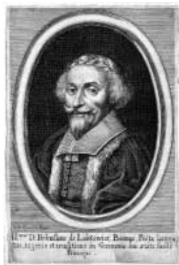
Portrét Bohuslava Hasištejnského

Výstava, kterou otevíráme, je trochu atypická. Nejde o výstavu jednoho umělce nebo uměleckého směru, ale o inspiraci osobností Bohuslava Hasištejnského z Lobkovic . Toto jméno jsme asi všichni kdysi zaslechli ve škole, ale hned jsme je zase zapomněli, protože jsme nabýli dojmu, že jde jen o jakési zaprášené svazky latinsky píšícího básníka, které nám dnes již mnoho neřeknou. Tento pocit v nás pěstovali i autoři dřívějších učebnic, pro které latinsky píšící feudál nebyl tím správným představitelem českého písemnictví. Opak je ovšem pravdou. V díle Bohuslava Hasištejnského najdeme řadu míst, která působí velmi současně a živě a jen stěží by nás napadlo, že byla napsána před pěti sty lety. Právě o tato místa v Bohuslavově tvorbě jsme opřeli naši výstavní koncepci, která je trochu nestandardní tím, že jsme se