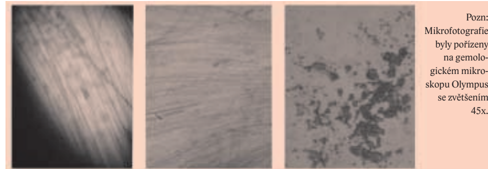
Pozn: Mikrofotografie byly pořízeny na gemolo- gickém mikro- skopu Olympus se zvětšením 45x.