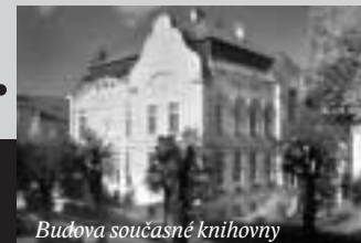
Budova současné knihovny

K výročí knihovny jsme připravili výstavu o historii její činnosti.