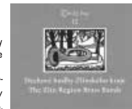
Dechové hudby Zlínského kraje