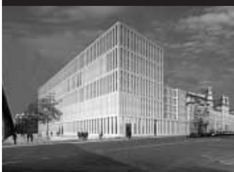
Sídlo Univerzitní knihovny Humboldtovy univerzity v Jacob und Wilhelm Grimm – Zentrum

Abych nebyl mylně pochopen, mé konstrukce nemají sloužit jako argument pro návrat ke starým, osvědčeným a krásným stavbám, abychom se vyvarovali nespolehlivosti hodnotících kritérií dnešní architektury. Mnohem více je naším úkolem nacházet „nové“ z naší doby a techniky vycházející formy a návrhy, které budou stejně tak krásné, jako trvalé. Existuje postup, podle kterého bychom mohli, jednotlivci či grémia, systematicky eliminovat rozdílné normy hodnocení, a poté dojít k uváženému rozhodnutí? Jaké normy a vlastnosti to jsou pro veřejnou stavbu, např. knihovnu? To, že pro architektky ztvárnění stavby a urbanizační aspekty mají a musejí mít prioritu, je