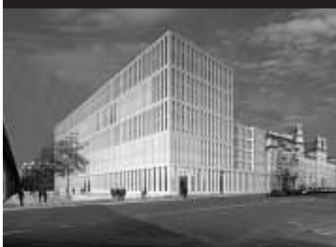
Sídlo Univerzitní knihovny Humboldtovy univerzity v Jacob und Wilhelm Grimm – Zentrum

Abych nebyl mylně pochopen, mé konstrukce nemají sloužit jako argument pro návrat ke starým, osvědčeným a krásným stavbám, abychom se vyvarovali nespolehlivosti hodnotících kritérií dnešní architektury. Mnohem více je naším úkolem nacházet „nové“ z naší doby a techniky vycházející formy a návrhy, které budou stejně tak krásné, jako trvalé. Existuje postup, podle kterého bychom mohli, jednotlivci či grémia, systematicky eliminovat rozdílné normy hodnocení, a poté dojít k uvážnému rozhodnutí? Jaké normy a vlastnosti to jsou pro veřejnou stavbu, např. knihovnu? To, že pro architektky ztvárnění stavby a urbanizační aspekty mají a musejí mít prioritu, je