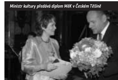
Ministr kultury předává diplom MĚK v Českém Těšíně