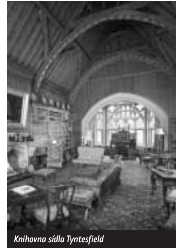
Knihovna sídla Tyntesfield

Práce Národního Trustu nikdy nekončí a platí to nejen pro všechna památková svěření, ale i pro tak odborně specializovanou součást jako jsou knižní fondy, které zdaleka nejsou jen atraktivním doplňkem historických interiérů, ale z hlediska společenských věd cenným a mnohdy unikátním historickým pramenem pro studium kulturních hodnot národa.