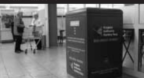
Bibliobox v Městské tržnici