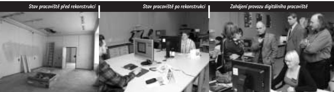
Zahájení provozu digitálního pracoviště