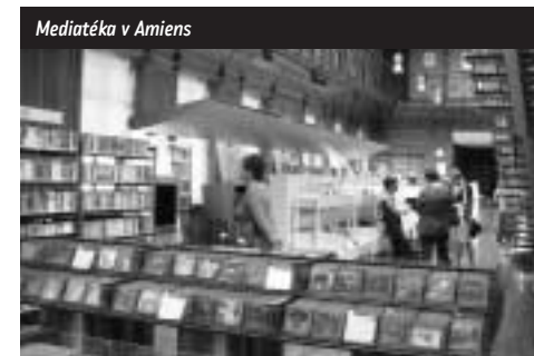
Mediátka v Amiens

nejmodernějšími reprografickými a komunikačními technologiemi. Součástí prohlídky knihovny byla návštěva výstavy „Pikardie v dokumentech“.