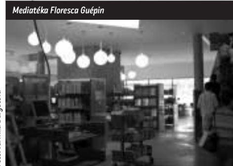
Mediatéka Floresca Guépin

V RENNES NAŠE STUDIJNÍ CESTA KONČILA. PO PROHLÍDCE „LES CHAMPS LIBRES“ ODVEZL AUTOBUS ÚČASTNÍKY S FRANCOUZSKÝM DOPROVODEM NA LETIŠTĚ CHARLES DE GAULLE V PAŘÍŽI. TY, KTEŘÍ SE ZÚČASTNILI KONGRESU ABF, DOPRAVIL AUTOBUS DO NANTES, KDE SE KONGRES KONAL.