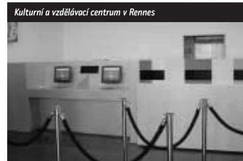
Kulturní a vzdělávací centrum v Rennes

Knihovna plní funkci regionální knihovny, začleněné do společenství knihoven Národní knihovny Francie. Jejím úkolem je shromažďovat, zpracovávat, chránit a zpřístupňovat veškerou vydavatelskou produkci a literární dědictví regionu. Má právo povinného výtisku. Kromě toho působí též jako metropolitní veřejná knihovna pro Rennes. Ve spolupráci s ostatními bretaňskými knihovnami vytváří souborný katalog literatury nacházející se v regionu.