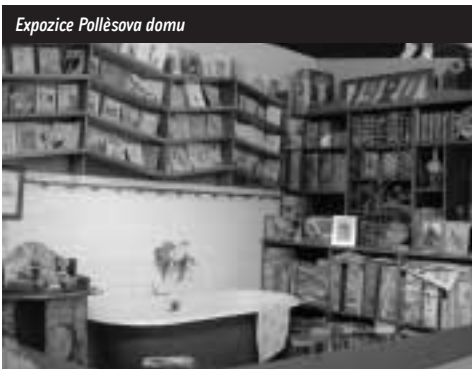
Expozice Pollèsova domu

čovat pouze v tomto oddělení). Zde se též pořádají autorská čtení, besedy a setkání se zajímavými osobnostmi atp. Ostatní podlaží jsou přístupná výtahy a centrálním schodištěm z chodby, která navazuje na vstupní prostory knihovny.