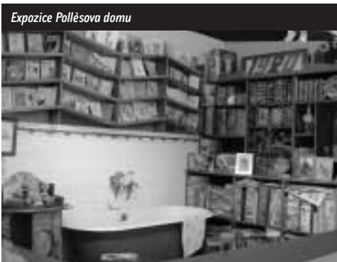
Expozice Pollèsova domu

čovat pouze v tomto oddělení). Zde se též pořádají autorská čtení, besedy a setkání se zajímavými osobnostmi atp. Ostatní podlaží jsou přístupná výtahy a centrálním schodištěm z chodby, která navazuje na vstupní prostory knihovny.