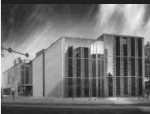
Centrální vědecká knihovna v Helsinkách