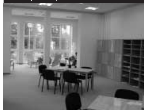
Čítárna s výhledem do parku