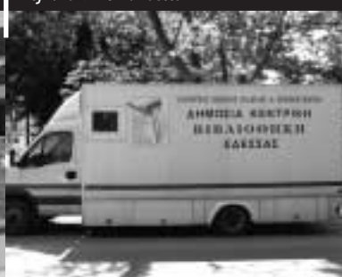
Pojízdná knihovna Edessa