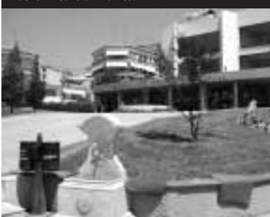
Duchovní centrum Janitsa