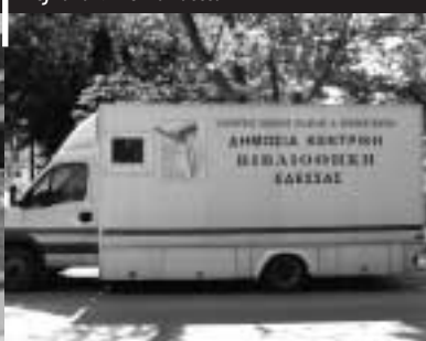
Pojízdná knihovna Edessa