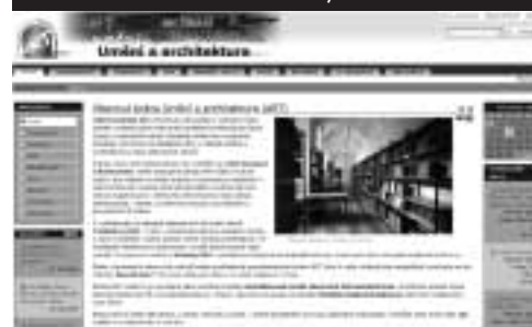
Obr. 1. Úvodní obrazovka oborové brány ART