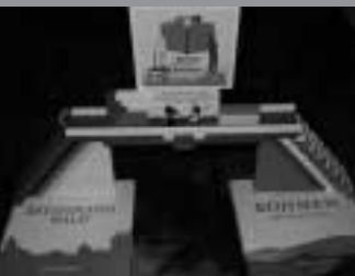
Bücher bauen Brücke – Knihy staví mosty mezi knihovnami i mezi národy

V pátek 24. října loňského roku navštívili zástupci Městské knihovny Klatovy svou partnerskou knihovnu v německém Chamu, kde tento den vyvrcholil projekt „Bücher bauen Brücke“ (Knihy staví mosty). Touto návštěvou byla zároveň prohloubena vzájemná spolupráce mezi oběma knihovnami, která se datuje od předchozího podzimu. Dne 1. října 2007 jsme totiž v Klatovech mohli v rámci Týdne knihoven , který tenkrát probíhal pod heslem „Týden bavorské kultury“, uvítat delegaci z Chamu a další významné hosty.