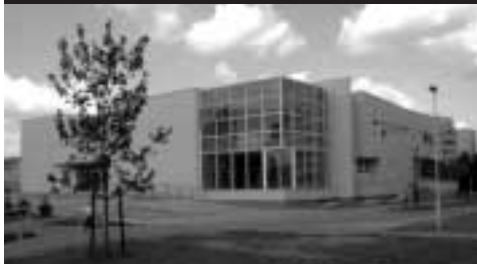
Univerzitní knihovna Univerzity Pardubice

■ V roce 2008 jste se stala předsedkyní Asociace knihoven vysokých škol (dále AKVŠ). O jejím založení se začalo hovořit již v roce 1999 a ustavující konference AKVŠ se konala v roce 2002. Můžete přiblížit tehdejší situaci a důvody, které vedly k tomuto kroku?