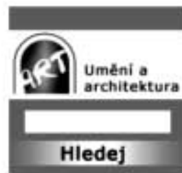
Obr. 4. Vyhledávací okénko ART

Stahování katalogizačních záznamů – pomocí protokolu Z39.50 server mohou knihovny s jakýmkoli knihovnickým systémem využívat katalogy oborové brány ART pro vzájemné přebírání záznamů. Tato spolupráce knihoven k ničemu nezavazuje, naopak mají možnost díky bráně ART rychleji zpracovat své fondy. Knihovny sdružené ve VUK si už vzájemně katalogizační záznamy poskytují; další institucí, která využívá katalogy oborové brány Umění a architektura pro přebírání záznamů, je např. Univerzita Jana Evangelisty Purkyně v Ústí nad Labem. Pokud budete mít i vy zájem o tuto formu spolupráce, je třeba vyplnit žádost o vytvoření profilu JIB pro přebírání záznamů na adrese http://jib-info.cuni.cz/prebirani .